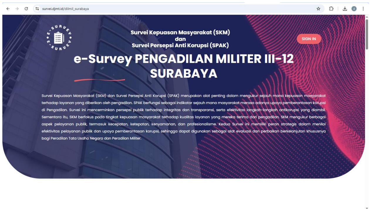
Gambar 1. Contoh kuesioner survey

Variabel pada pengukuran ini didasarkan pada hal-hal yang dapat memicu timbulnya korupsi dalam penyelenggaraan layanan pengadilan, yaitu terdiri dari 4 unsur, antara lain: